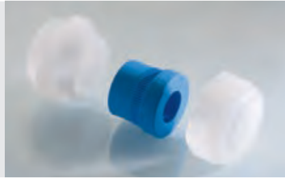
Abb. 2 Fig. 2

PVDF, Farbe: transparent, blau (RAL 5015), schwarz (RAL 9005) Metrisches Anschlussgewinde EN 60423 Schutzart IP 68 bis 10 bar Zugentlastung bis Klasse A, EN 62444