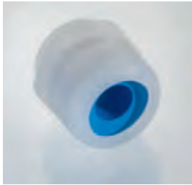
Abb. 1 Fig. 1