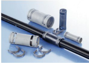
Connection Splice or flexible Conduits, IP68