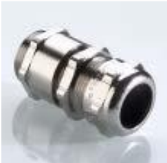
Abb. 1 Fig. 1