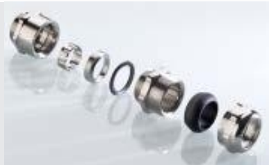
Abb. 2 Fig. 2

Messing vernickelt Metrisches Gewinde EN 60423 Schutzart IP 66, IP 68 bis 15 bar