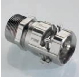
Abb. 1 Fig. 1