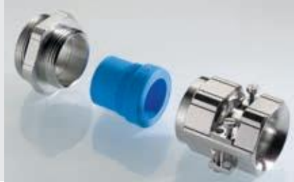
Abb. 2 Fig. 2

Messing vernickelt Metrisches Gewinde EN 60423 Schutzart IP 68